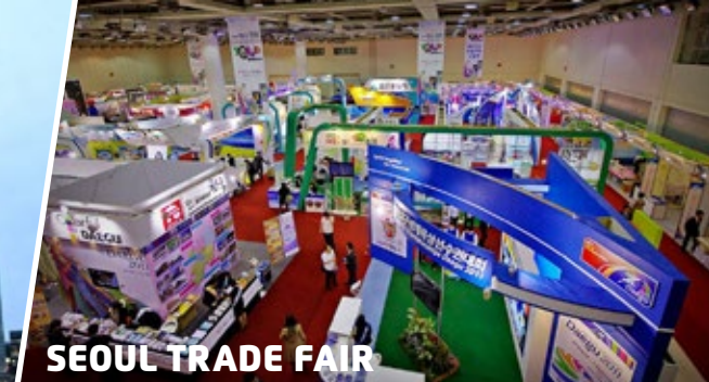
SEOUL TRADE FAIR